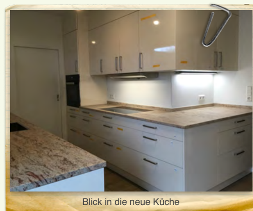
Blick in die neue Küche

Aufgrund dieser Zusage einer einzelnen Spende waren wir in der glücklichen Lage, die komplette Küche ohne eigene Haushaltsmittel finanziert zu bekommen und auszutauschen. Im Dezember wurde sie nun eingebaut und erfreut sich bei allen, die sie benutzen, großer Beliebtheit. Wir alle danken Frau Elke Gerriets herzlich für dieses große Geschenk, das sie mit ihrer äußerst großzügigen Spende der ganzen Kirchengemeinde gemacht hat.